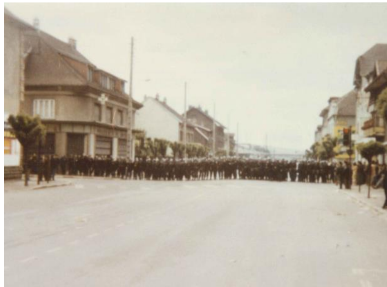
Barrage de CRS aux portes de l'usine Peugeot à la portière de Sochaux, 11 juin 1968, AMM 1Fi66.

Les discussions débouchent sur plusieurs mesures qui vont au-delà des accords de Grenelle : une augmentation des salaires, des indemnités en cas de maladie et l'indemnisation des jours de grève.