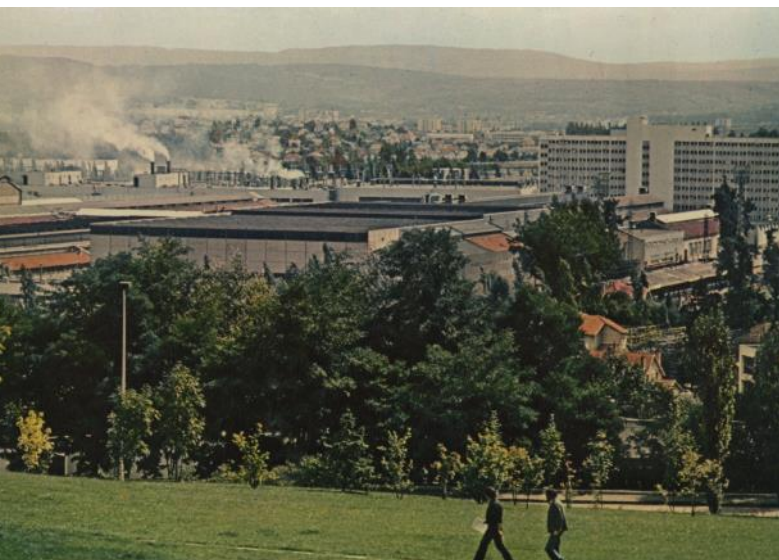
Les usines Peugeot vers 1970, AMM 20Fi1222.

Les années 60 sont des années de mutations sociales, économiques et idéologiques. Pendant les « Trente Glorieuses » (1946-1976), le développement économique s'appuie sur une population jeune et très nombreuse. Dans le Pays de Montbéliard, fortement industrialisé, on compte environ 27 000 salariés dans l'usine Peugeot de Sochaux : c'est « la plus grosse usine de France ». De nombreux quartiers voient le jour (Petite Hollande, Chiffogne, Champs-Montants, Champvallon, les Buis, etc.) avec des appartements au confort moderne. Les progrès de la technologie engendrent un gain de productivité et de meilleurs rendements. De nouveaux produits sont rendus accessibles dans les magasins de la grande distribution.