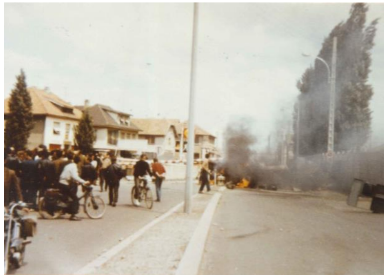
Barricade aux abords de l'usine Peugeot à Sochaux, 11 juin 1968, AMM 1Fi71.

En France, les événements de Mai 68 ont officiellement provoqué la mort de 7 personnes. Loin d'être une simple révolte, Mai 68 a été l'expression d'une rupture avec les normes sociales et une remise en cause du pouvoir en place.